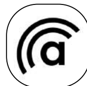
Iconização da Logo em Preto