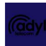
Logo preta em fundo escuro