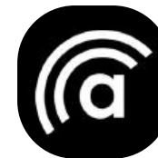
Iconização da Logo com fundo preto