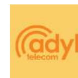
Logo colorida em fundo colorido