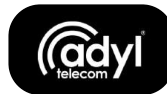
Logo branca em em fundo escuro